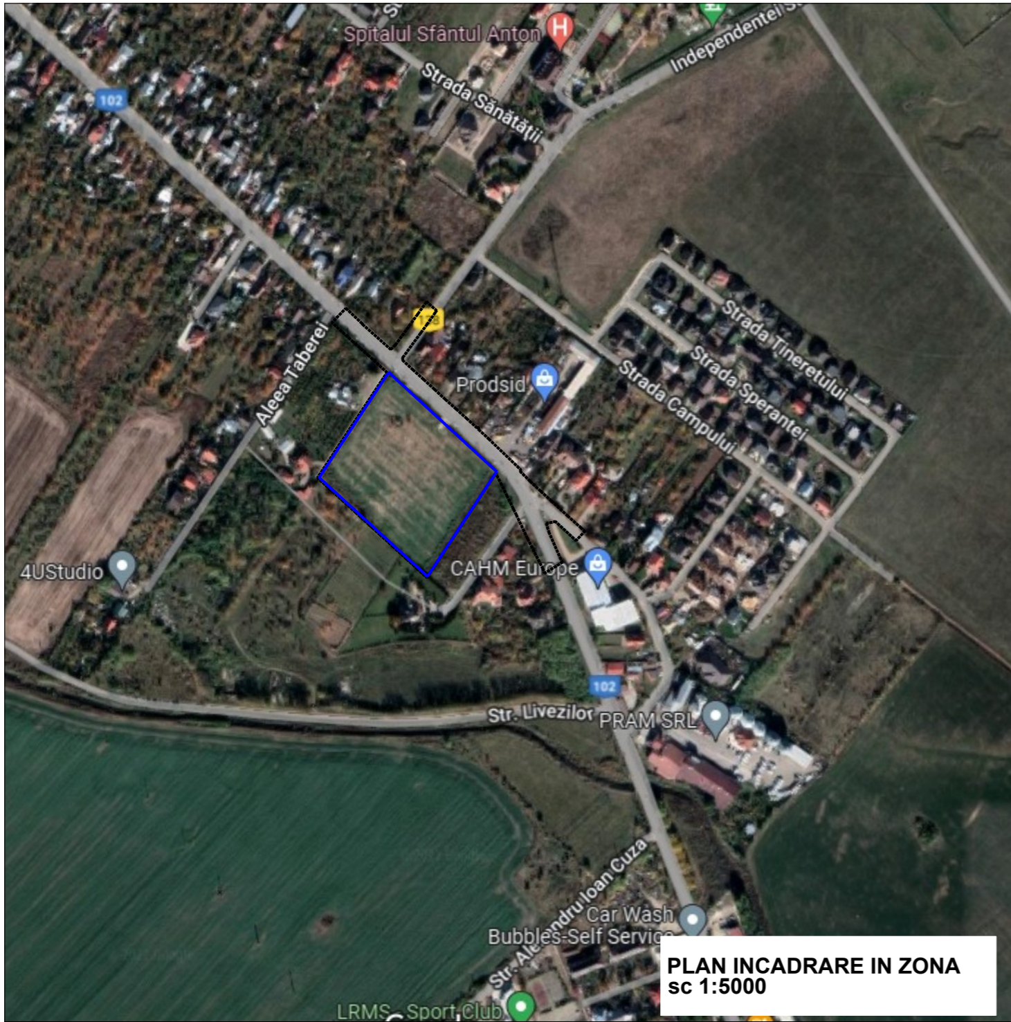
PLAN INCADRARE IN ZONA sc 1:5000